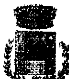
Comune di Bologneta