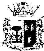
Comune di Marineo