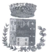
Comune di Bolognetta