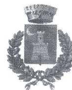
Comune di Cefalà Diana