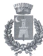
Comune di Cefalà Diana