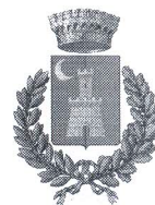
Comune di Cefalà Diana