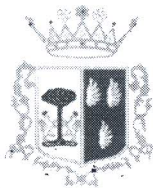
Comune di Marineo