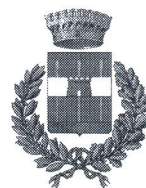
Comune di Godrano