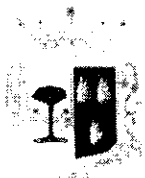
Comune di Marineo