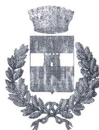
Comune di Godrano