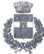
Comune di Godrano