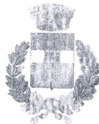
Comune di Godrano