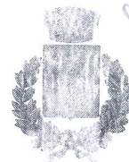
Comune di Cefalà Diana