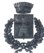
Comune di Cefalà Diana

Rep. N. 701 del 20/06/2014 al 06/07/2014