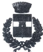
Comune di Godrano