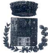
Comune di Bolognetta